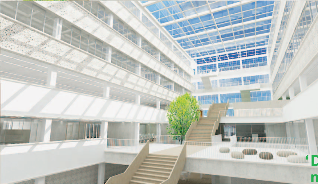
TNT Green Headoffice, Hoofddorp

van het nieuwe werken waarin het flexwerken al werd doorgevoerd. In de jaren hierna is het nieuwe werken steeds meer in opkomst gekomen. Met het onlangs opgeleverde Swung House in Den Haag presenteerde Ex een nieuw kantoorconcept dat inspeelt op het toekomstig werken. “Swung House is een flexibele werkomgeving voor zelfstandige ondernemers die voor korte of langere tijd werkruimte nodig hebben. Voor ZZP’ers, thuiswerkers, maar ook professionals die onderweg een paar uur willen werken of werknemers die hun eigen kantoor willen ontvluchten om zich volledig te kunnen concentreren. Het is een plek waar mensen werken, netwerken, elkaar ontmoeten en inspireren.”