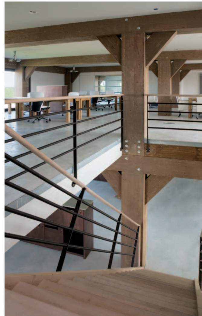
Huis de Wiers, Vreeswijk

Naast het appartement en de architectenbureaus Ex Interiors en De Visser, herbergt Huis de Wiers een restaurant en een ict-bedrijf. De Visser ontwierp het pand op het oorspronkelijke souterrain uit 1654. Omdat de oude fundering geen zware constructie kon dragen, werd het geheel opgetrokken uit hout. In het interieur, dat Ex voor haar rekening nam, zijn de kolossale houten spanten van de constructie alles bepalend. Behandeld met een matte grijs-bruine beits hebben ze een warme uitstraling die goed past bij Ex' keuze voor onbehandelde, betonnen vloeren en wanden.