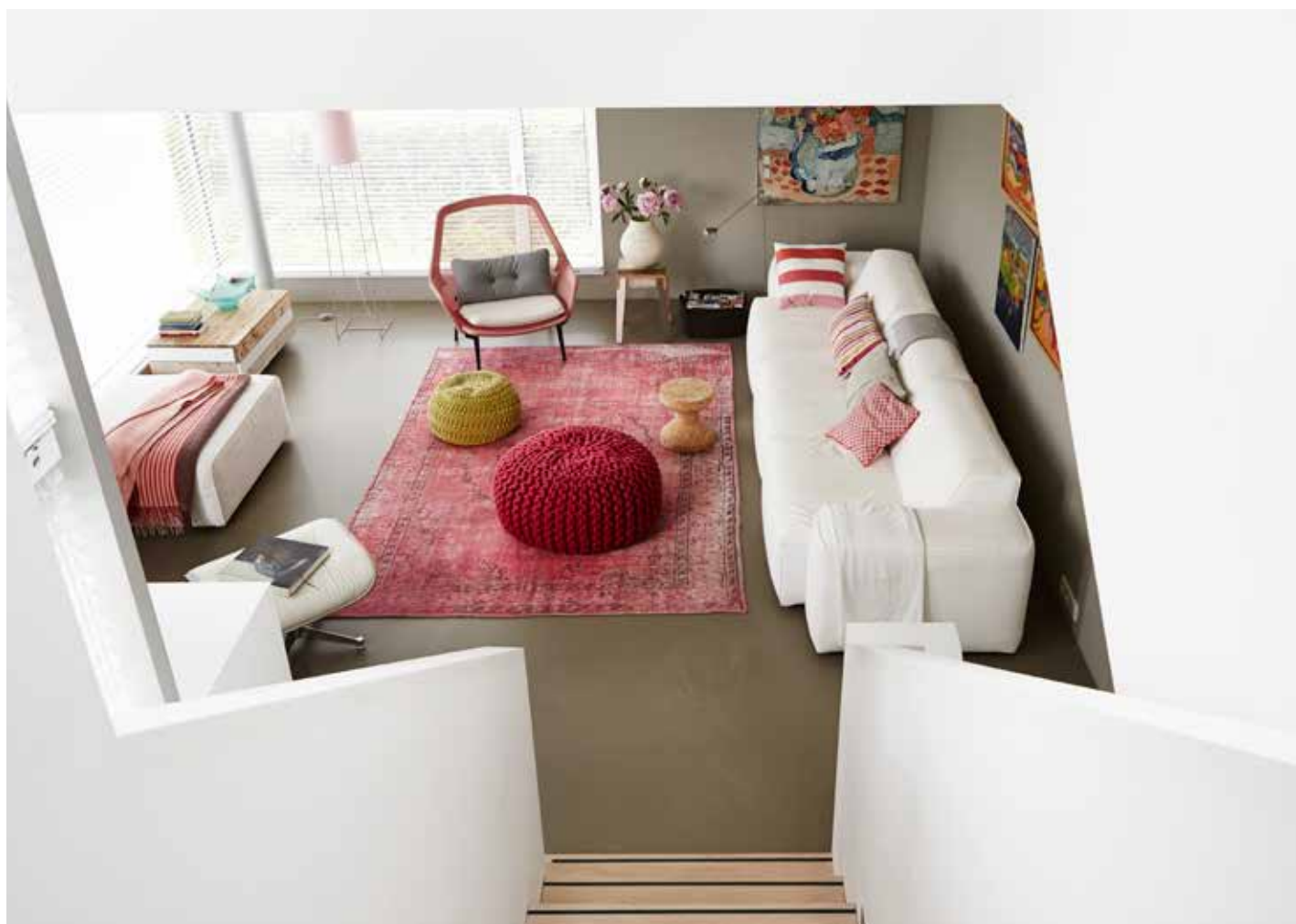
OP DE SLOOPHOUTEN BIJZETTAfel VAN PIET HEIN EEK STAAT VAAS JONSBERG, ONTWERPEN DOOR HELLA JONGERIUS VOOR IKEA. HET ROZE VLOERKLEED KOMT VAN VLOERKLEDENWINKEL.NL, DE ROZE VLOERLAMP SLIM SOPHIE IS VAN FRAUMAIER.