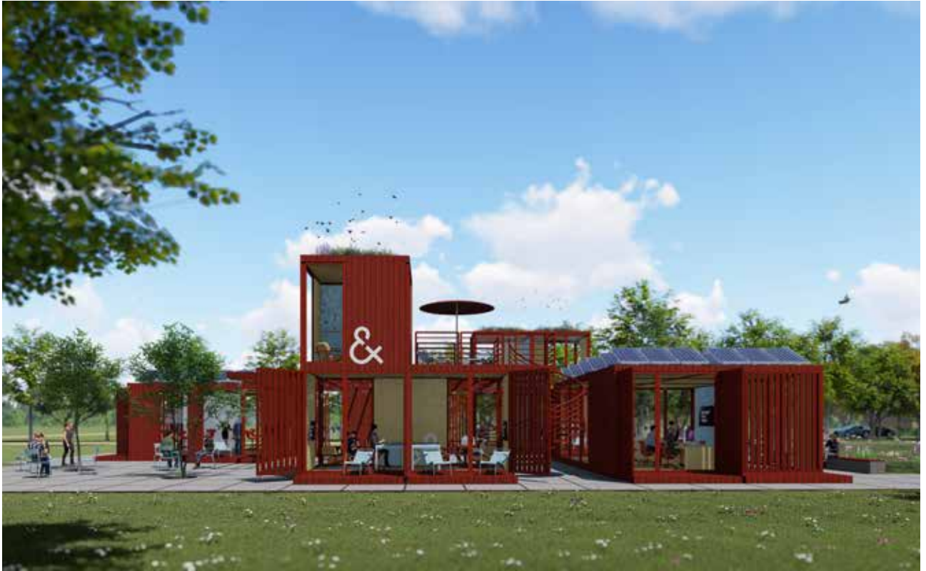
FL'EX-BOX door Ex Interiors

afstemming van pure materialen, waardoor de omgeving positief op je inwerkt. Zulke gebouwen stralen een warm comfort uit. De ronde vormen, maar ook de eenduidige toepassing van gelamineerde vurenhouten spanten, kernen en plafond bijvoorbeeld, laten het gebouw van Triodos 'ademen'.