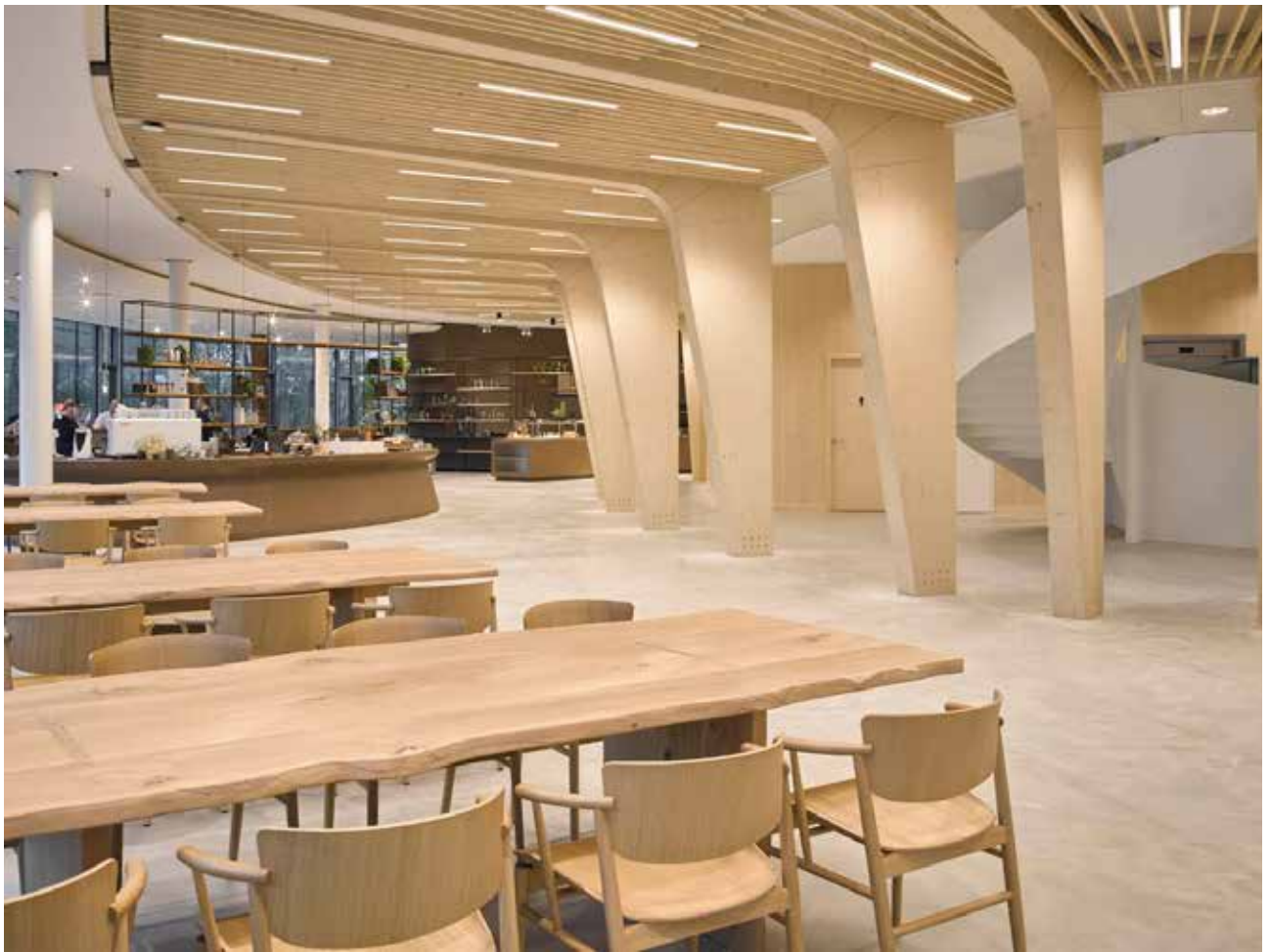
Triodos Bank in Zeist door RAU en Ex Interiors

reiken van vloer tot plafond en zorgen voor optimale transparantie. Voor het plafond hebben we de onderzijde van de paddenstoel met zijn sporen als uitgangspunt genomen. De begane grond is het ontmoetingsgebied. Waar je ook staat, voel je de verbinding met de natuur. Het pand is volledig remontabel en dus opnieuw ergens anders op te bouwen.