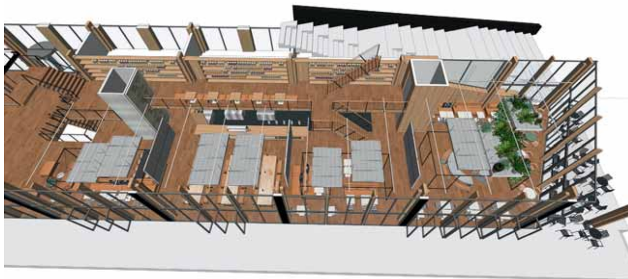
BOVEN Plattegrond begane grond.