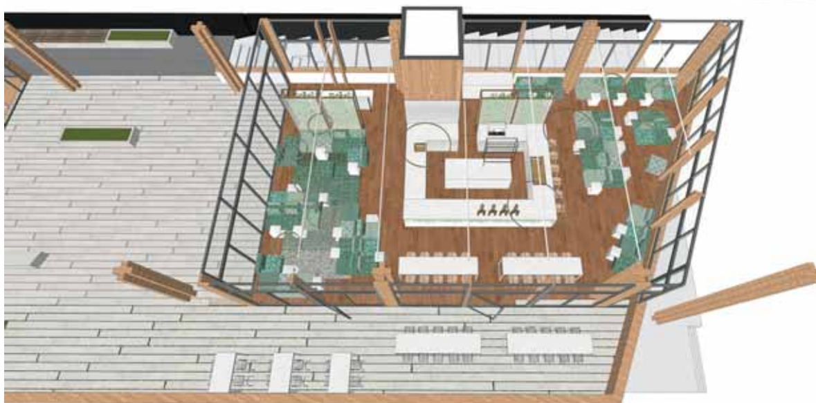
ONDER Plattegrond eerste verdieping.