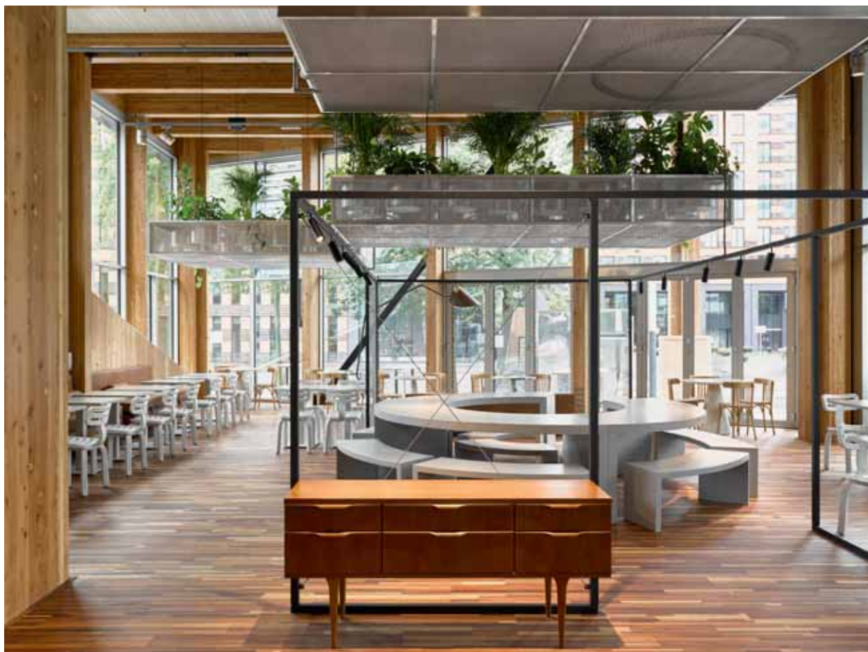
FOTO BOVEN De grote ronde tafel in een van de frames.