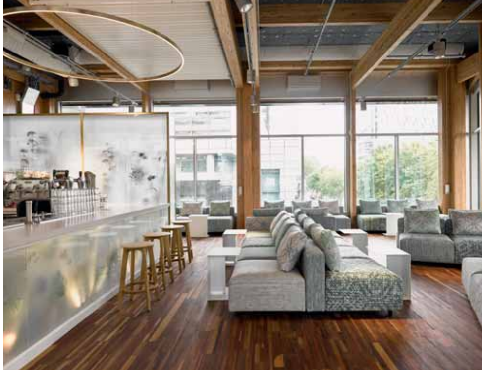
FOTO ONDER In de melkglazen vitrines staan planten en bloemen die worden gebruikt voor infusen.

kind had “met droogbloemen aan het plafond en weckpotten in de kelder. De kennis van zaken als wecken, drogen en fermenteren is bijna verloren gegaan en het is mooi dat dat hier weer gebeurt.”