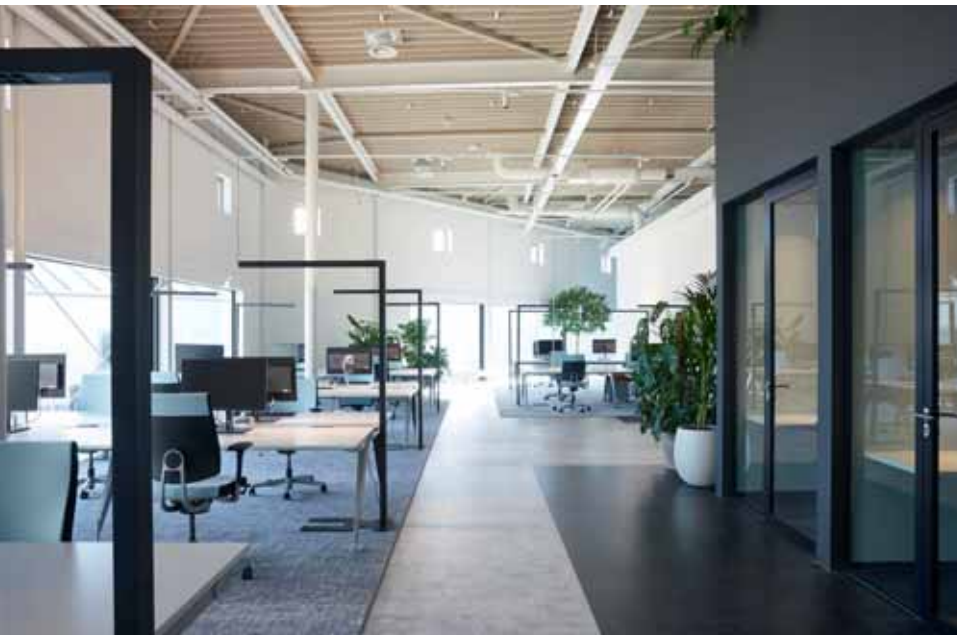
FOTO LINKS Het ontmoetingsplein ademt 'tech' dankzij de combinatie van materialen als beton en metaal, en doordat de installaties in het zicht zijn gelaten.

Opdrachtgever Nedap Retail Interieurarchitect Ex Interiors Architect KW Bouwstudio Vast meubilair Stooff Wandsystemen Verwol Verlichting Studio Rublek Vloerbedekking Van Besouw, Tarkett, Moooi Carpets Stoffering Kvadrat Los meubilair Sedus, DeVorm, Lensvelt, DUM Office, &Tradition, Arco, Blå Station, Fermob Beplanting Ten Brinke Interieurbeplanting Aannemer Kormelink Bouwmanagement inbouwpakket Kleissen Installatieadviseur Enervisie Vloeroppervlak 2070 m 2