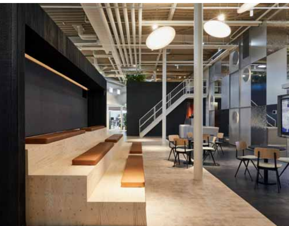
FOTO ONDER Achterin de hal bevindt zich de bar voor de medewerkers, met daarnaast een groot podium met tribune waar presentaties kunnen worden gegeven.

gesloten kantoor – waarbij er een specifieke behoefte was aan meer daglicht – tot een open en transparante ruimte door middel van doorbraken in de gevel en lichtkoepels in het dak. Systeemplafonds werden verwijderd, akoestisch materiaal toegevoegd. De hoogte van de hal draagt bij aan de prettige sfeer in het kantoor, die al bij de entree merkbaar is. Ex:” Als je het gebouw binnenkomt, vind je links de showroom, in de vorm van een conceptstore waar je de laatste technologische trends kunt zien. Rechts word je verwelkomd bij de koffiebar met een mooie rond gebogen betonnen uitgiftebalie. Op het grote ontmoetingsplein hebben we zitjes, aanlandplekken en