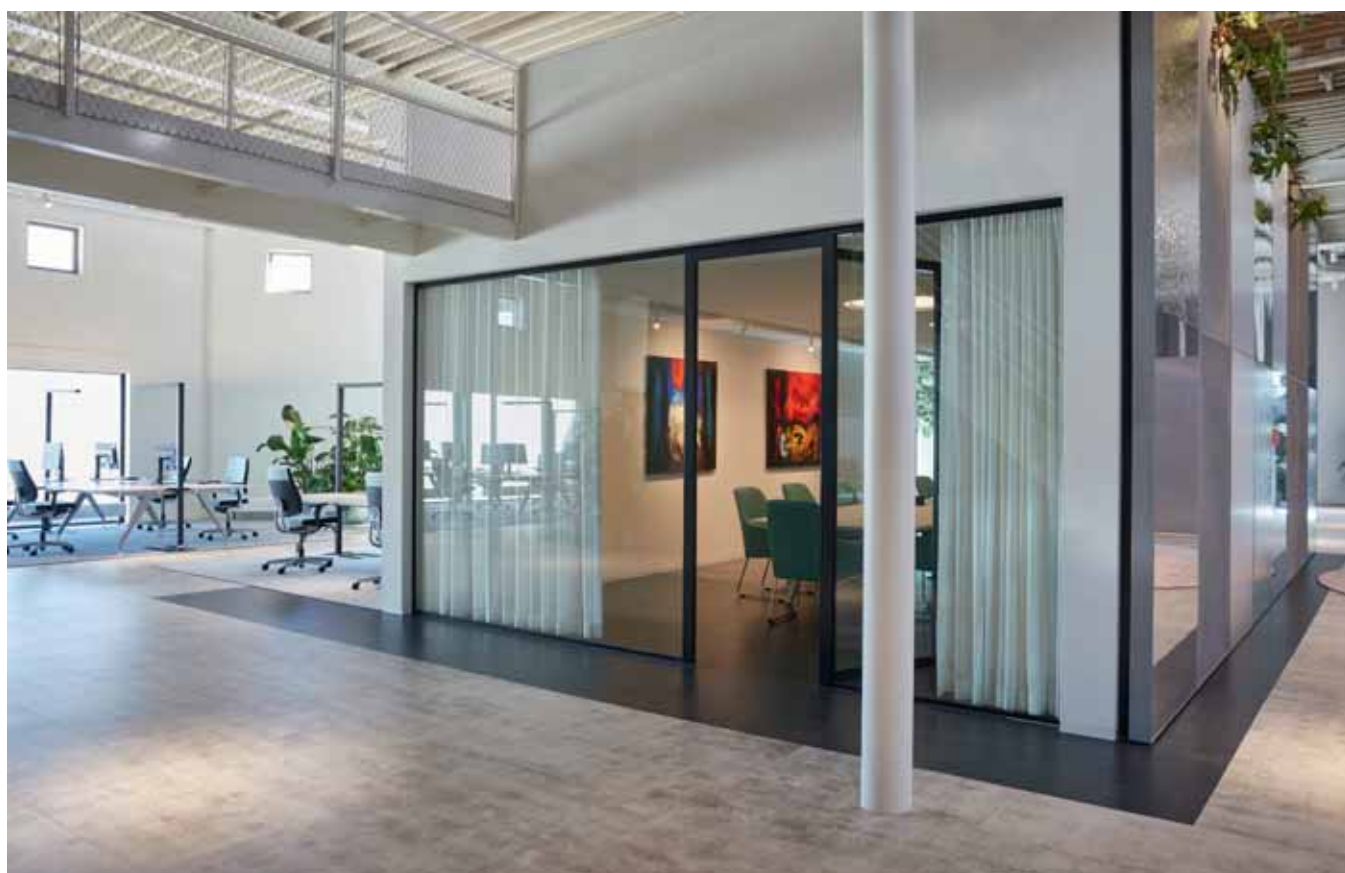
FOTO ONDER Deze los van elkaar staande volumes kunnen gebruikt worden om te werken, te vergaderen enzovoorts.